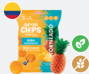
Chips horneados* Baked chips