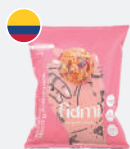
Bolitas de energía* Energy balls