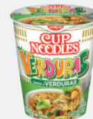
Fideos instantáneos* Instant noodles